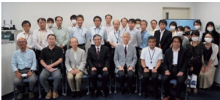
情報統括本部退任のご挨拶にて

今回退任にあたり、情報関係だけは、「情報統括本部の皆様が分かってくださっているので安心して引継げる」という意味で私が安心して引き継げた唯一の担当分野でございます。是非、今後ともフィジカルには日本一のキャンパスと言われますが、サイバー空間としても日本一のキャンパスであり続けていただきたいと思います。情報統括本部におかれましては、極めて急速に変化する情報技術の発展の中で、先手先手で新しい技術を取り入れて九州大学を支えてください。「今日の常識は3年後の非常識」と常に考えながら、日々業務に励んでいただきたいと思います。常にフレッシュな感覚を持って新しいキャンパスづくりに引き続きご尽力いただきたいと思います。大学の構成員の皆様も、ぜひ、この優れた情報基盤を活用し、それぞれの教育・研究で大きな成果を挙げていただきたいと思います。